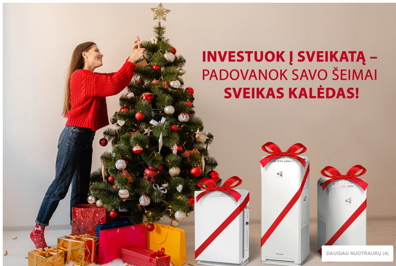
„Daikin“ oro valytuvai.

„Daikin“ oro valytuvai ir drėkintuvai skirti iki 100 kv. m komercinės ar gyvenamosios paskirties patalpoms, kuriose jie geba efektyviai sunaikinti ore sklindančias virusų daleles, alergenų, bakterijas ir nemalonus kvapus.