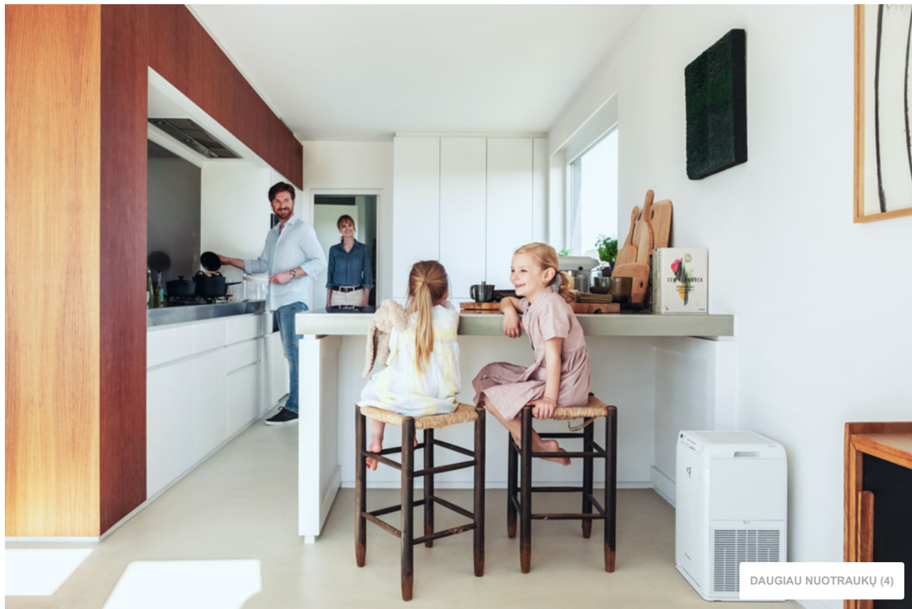
„Daikin“ oro valytuvai.

Triukšmas. Gali būti, kad svarstydami apie visas technines ypatybes nepagalvosite apie patalpų oro valytuvo skleidžiamą garsą. Greičiausiai apie jį nesusimąstysite, kol neįjungsite prietaiso ir neišgirsite garso. Tad lygindami sistemas būtinai patikrinkite jų decibelais matuojamą (dBA) triukšmo lygį. Perskaitykite straipsnį „Kaip sumažinti triukšmo taršą namuose“ ir daugiau sužinokite apie tai, kaip pasinaudoti patalpų oro valytuvo pranašumais ribojant jo keliamą triukšmą.